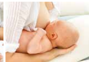
Dojenje držanjem ispod ruke