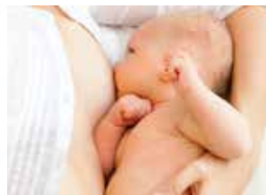
Dojenje u ležećem položaju

Savjet: Kako biste pomogli bebi da pusti bradavicu, pažljivo stavite vrh malog prsta u kut bebinih usta. To će prekinuti sisanje i lako možete skinuti bebu s grudi.