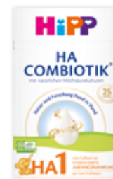
HiPP HA 1 COMBIOTIK®