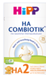
HiPP HA 2 COMBIOTIK® ✓ nakon bilo koje HA mliječne formule