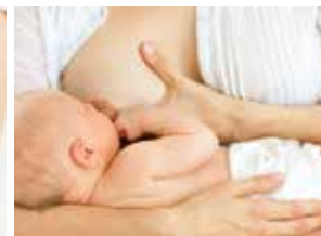
Dojenje u naručju